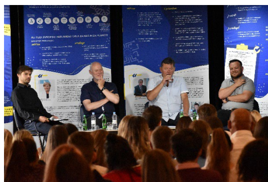
Sodelovanje v razpravi »Mladi oblikovalci modernega sveta« v Murski Soboti