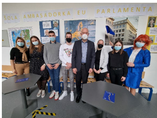
Srečanje in pogovor z dijaki Ekonomske šole Ljubljana