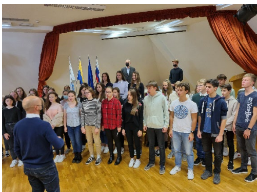
Srečanje in pogovor z dijaki I. gimnazije v Celju