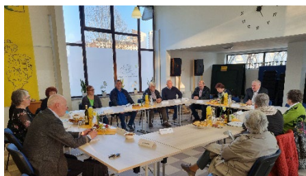
Srečanje in pogovor s člani Društva upokojencev Velenje